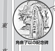
角倉子以の記念碑